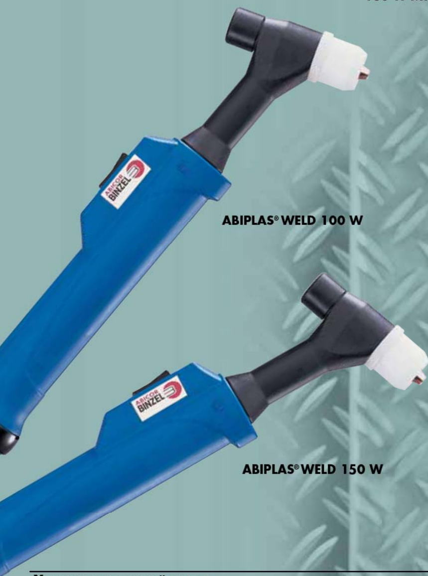
ABIPLAS® WELD 100 W MT

ABICOR BINZEL предлагает новое поколение экономичных плазменных горелок ABIPLAS® WELD. Благодаря небольшим размерам горелки облегчается работа с деталями самых сложных геометрических конструкций. Стабильный сварочный процесс гарантирует работу без брызг и высокое качество шва. Благодаря этому нет необходимости в доработках после сварочного процесса как ручным, так и автоматическим способом.